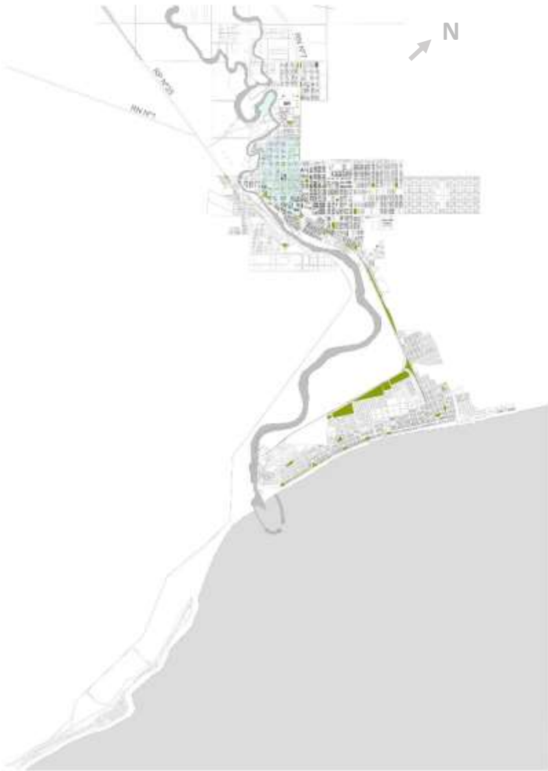
Plano General de la Ciudad de Rawson