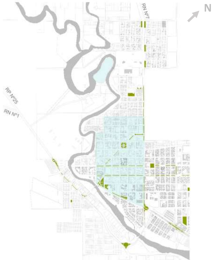
Plano Centro Cívico de la Ciudad de Rawson